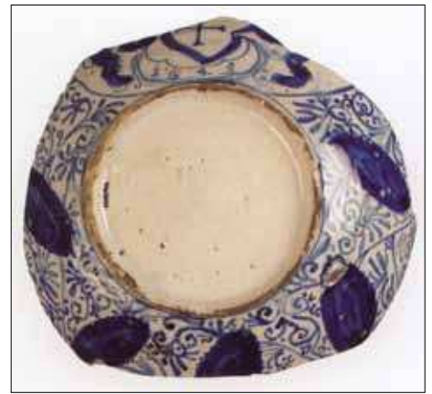
Abb. 8: Portugiesische Fayenceschale mit Wapendarstellung.

Nach dem Niedergang der syrischen und ägyptischen Produktionsstätten übernahm Venedig die Herstellung und belieferte Europa, aber auch den Orient mit seinen Waren. Da orientalische Gläser sowohl von Burgen als auch aus Stadtkernen und Klöstern bekannt sind, zählten nicht nur Adlige, sondern auch wohlhabende Bürger zu ihren Besitzern. Dazu gehörte im 14. Jahrhundert auch eine namentlich erwähnte Lübe-