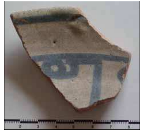
◁ Abb. 2: Fragmente von Lüsterfayence aus Fulda.