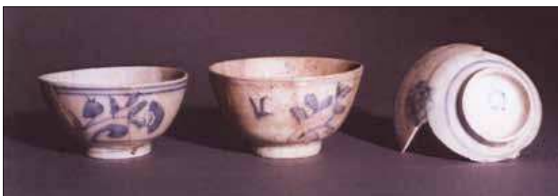
Abb. 4: Persische Fayence aus Baja/Ungarn.