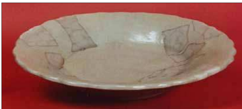
Abb. 9: Fragmente eines Seladontellers aus Buda.